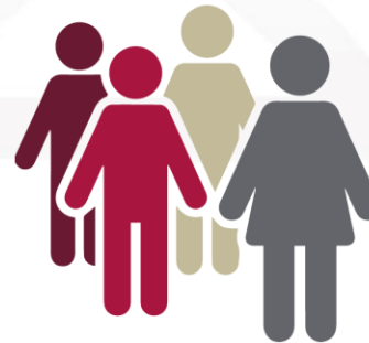
Comités de Contraloría Social